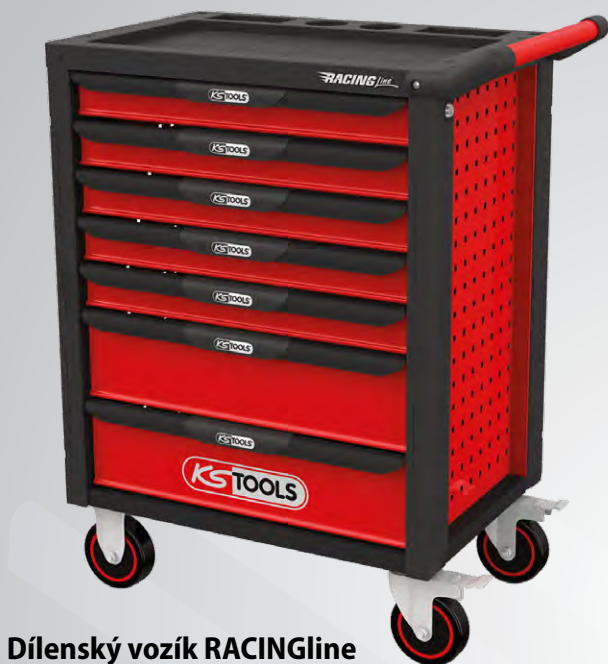
Díleňský vozík RACINGline