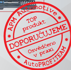
Díleňský vozík ECOLine